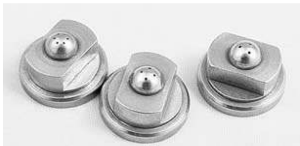
3 otwory-okrągły wzór